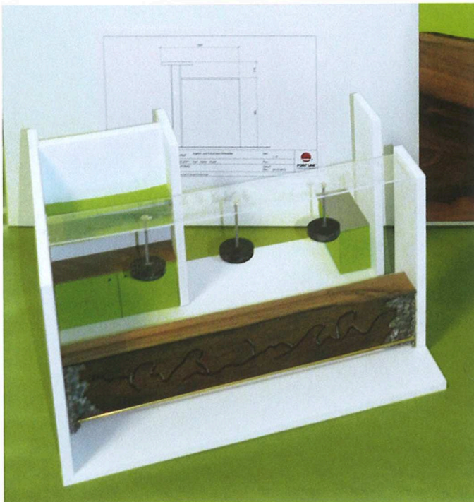
1:10-Modell der Siegerarbeit im Gestaltungswettbewerb.