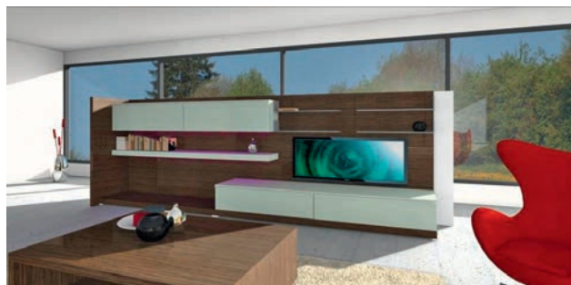
Exemple d'aménagement dessiné avec PointLine