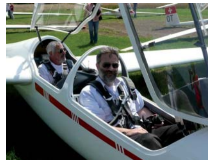
Flug-Event Mitarbeiter, Sommer 2007

Ski-Weekend auf dem Stoos, CH Flug-Weekend in Grenchen, CH Österreichische Kulturreise, AT