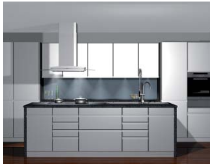
Küche gezeichnet mit PointLine3D gerendert

PointLine3D ist CAD für höchste Ansprüche. Geplant wird dreidimensional, und die Ergebnisse können schwarz-weiss, farbig oder fotorealistisch dargestellt werden. Parametrisierte 3D-Bibliotheken in „Komponenten-Bauweise“ ermöglichen, auch komplexe