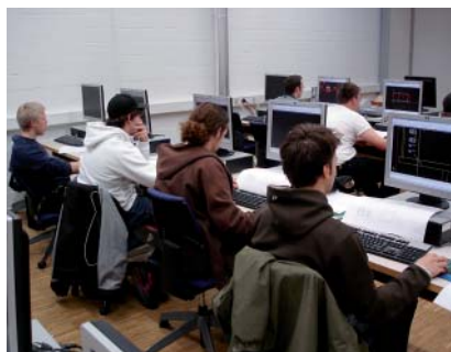
Konzentrierte Zeichner im CadCamp

Das CadCamp gehört fest zum BORM-Engagement für Aus- und Weiterbildung. Es wird künftig mindestens zweimal pro Jahr stattfinden.